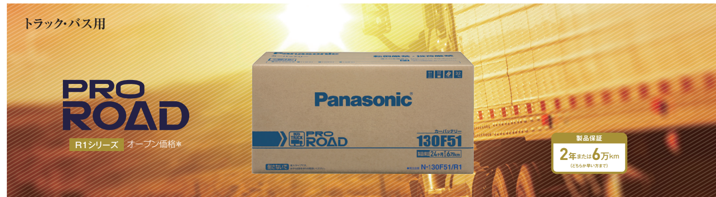
□ プロロード 要項表 R1/R3シリーズ 5サイズ 13品番 オープン価格*