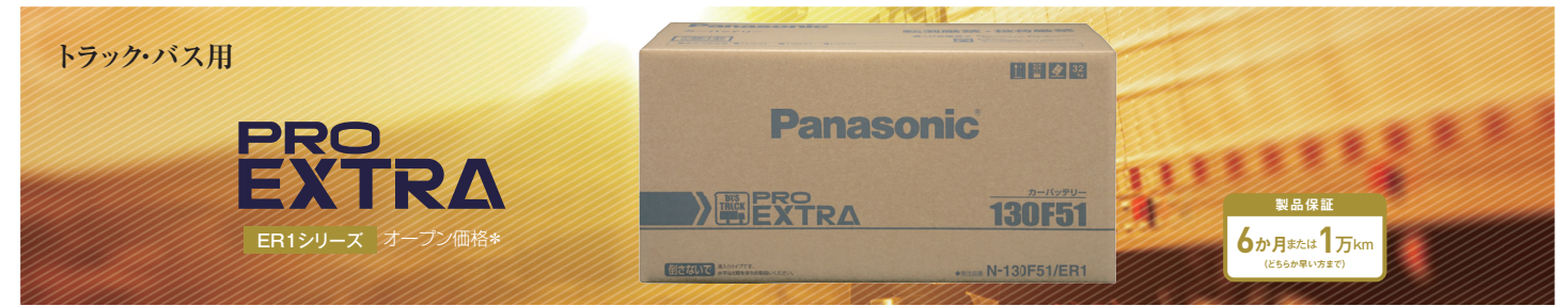
□ プロエクストラ 要項表 ER1シリーズ 1サイズ 1品番 オープン価格*

*) オープン価格商品の価格は販売店にお問い合わせください。※写真や画像はイメージです。実際とは異なる場合があります。