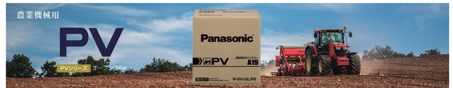
□ ビービー 要項表 PVシリーズ 5サイズ 10品番 オープン価格*