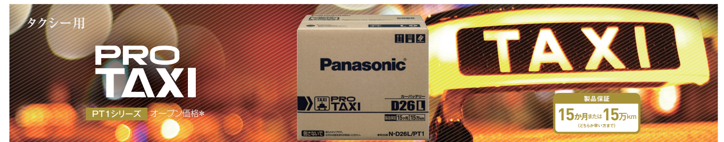
□ プロタクシー 要項表 PT1シリーズ 1サイズ 2品番 オープン価格*