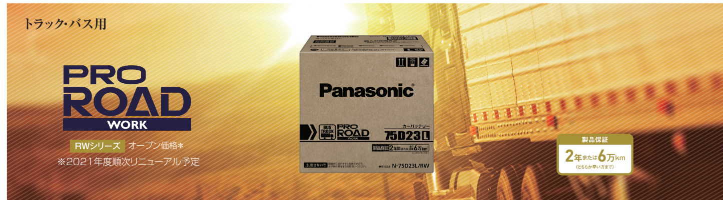
□ プロロードワーク 要項表 RWシリーズ 3サイズ 8品番 オープン価格*